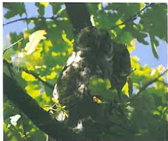
Hibou Moyen-Duc

Pour effectuer les observations nécessaires à l'établissement des données, la Station de Sempach s'appuie sur un grand nombre de collaborateurs bénévoles, ornithologues amateurs, dont je fais partie. Durant la période de nidification (février à juillet), le carré kilométrique doit être parcouru 3 fois sur un cheminement précis. Tous les oiseaux observés sont répertoriés. Cette tâche commence peu avant le lever du jour et dure environ 3 à 4 heures maximum. Sur ce