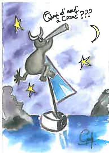
Aquarelle de Madame Sandra Czich