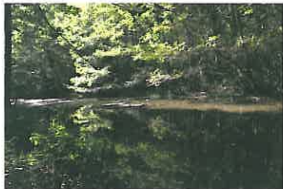
Etang de la Pierre Féline en fin d'été.

suivi scientifique, l'aménagement d'espaces naturels, principalement en Suisse romande. L'entretien des réserves naturelles de la région