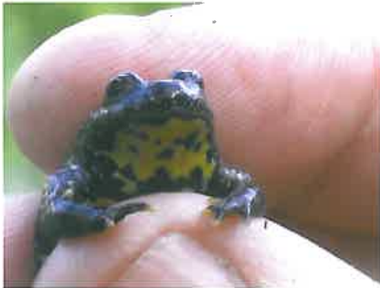
Sonneur à ventre jaune dans la main de H. du Plessix

Enfin, un plan d'actions est prévu pour la grenouille agile et le sonneur à ventre jaune sur le périmètre Vesancy-Versoix. Il s'agit de 2 espèces menacées en Suisse, caractéristiques des milieux forestiers humides, qui se reproduisent dans des plans d'eau forestiers temporaires à ensoleillement important. Le déclin de ces espèces est dû à la faible densité des sites de reproduction adéquats et aux ruptures du cycle biologique à cause des infrastructures de transport et de la mise sous terre des cours d'eau. Le plan prévoit l'aménagement de 14 nouveaux sites de reproduction (dont 10 entre VD et GE) et de groupes de mares forestières (31 sur VD et GE).