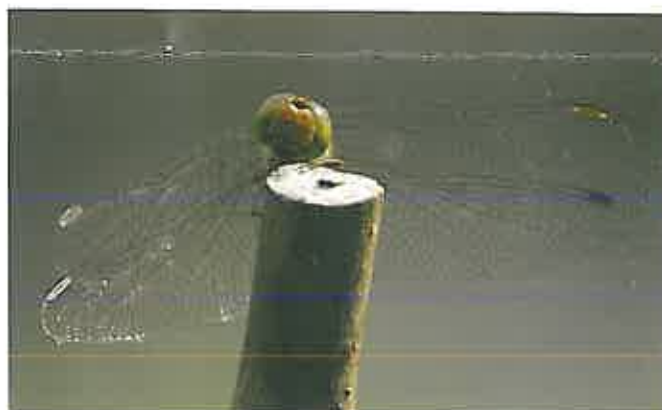
Sympetrum strié, libellule des zones humides, photo Laurent Buser, Crans août 2013

Toujours à Crans, une action est à l'étude pour le rétablissement de la continuité écologique du corridor aquatique du Nant de Pry , dérivation de la Versoix. Ce cours d'eau est en effet essentiel pour les poissons, batraciens et insectes et aussi pour les ongulés. Il est indispensable aux déplacements de toute cette faune vers des sites de reproduction ou d'hivernage. Or, l'urbanisation et la canalisation de certains tronçons diminuent la fonction écologique du corridor. Le passage