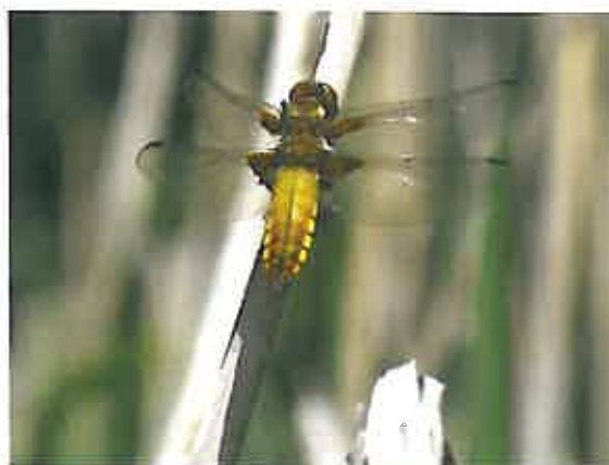
« Libellule déprimée »

La Fondation a pour but la protection, la