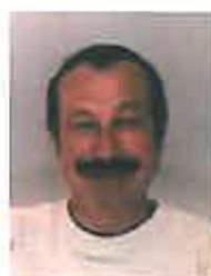
Albert Sinner Entretien des routes et véhicules