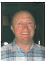
Denis Bajulaz Centre sportif, Conciergerie