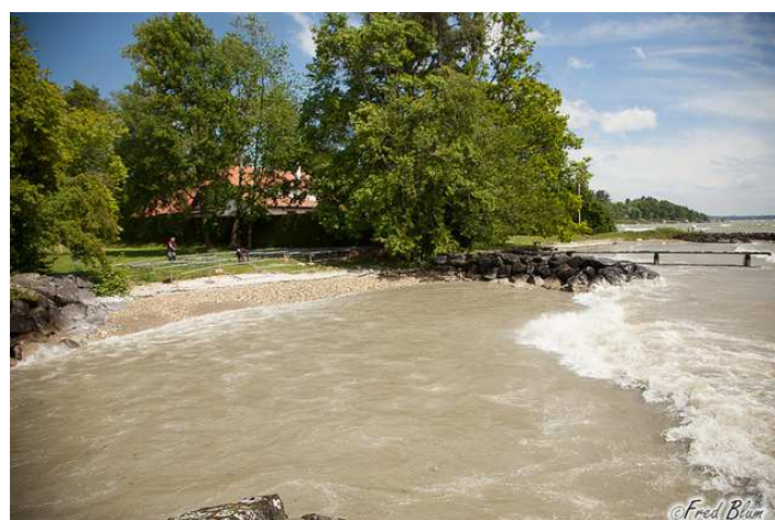
Un bord de lac digne des Caraïbes !