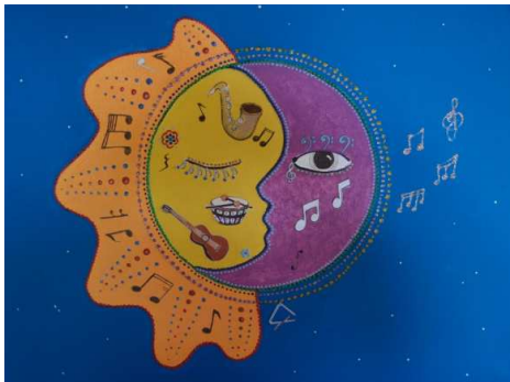
Tableau de Francesca Valerio, Crans, voir ghirigoriarte.blogspot.com