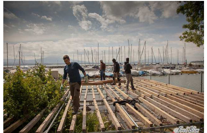
Montage 2014