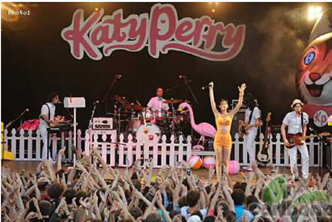
Katy Perry en 2009

Le premier festival de 1989, entièrement gratuit et installé sur le site du port de Crans,